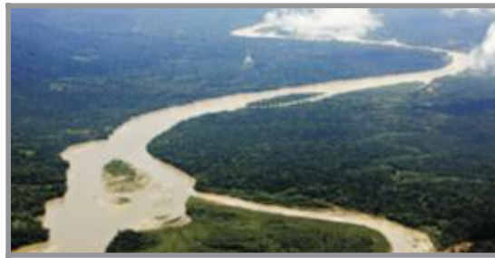
LAVJUNDEL: Elvene er de mest farbare veiene gjennom grønnsværet som fotografen kalte broccoli. Inn til landsbyen Sepahua må du i fly.