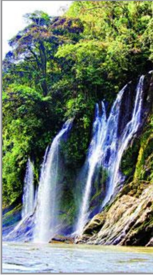
BJØRNEJUDET: Fossene styrter seg ned i juvet der elven går i brå kast under.

flyr vi ikke. Det er bandittland. Fem politifly er foreløpig skutt ned der. – Kokainbaroner, brølte han gjennom larmen. Så smilte han lurt og sa; følg med nå! og slapp halen på flyet brått ned.