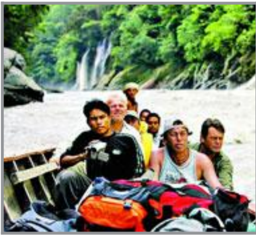
SPENT STEMNING: Gjennom Bjørnejuvet var det nokså taust i båten. Alle kikket fremover mot bølgene og fotografen i baugen.

Piloten dunket meg i siden og pekte oppover Rio Ene. Dit