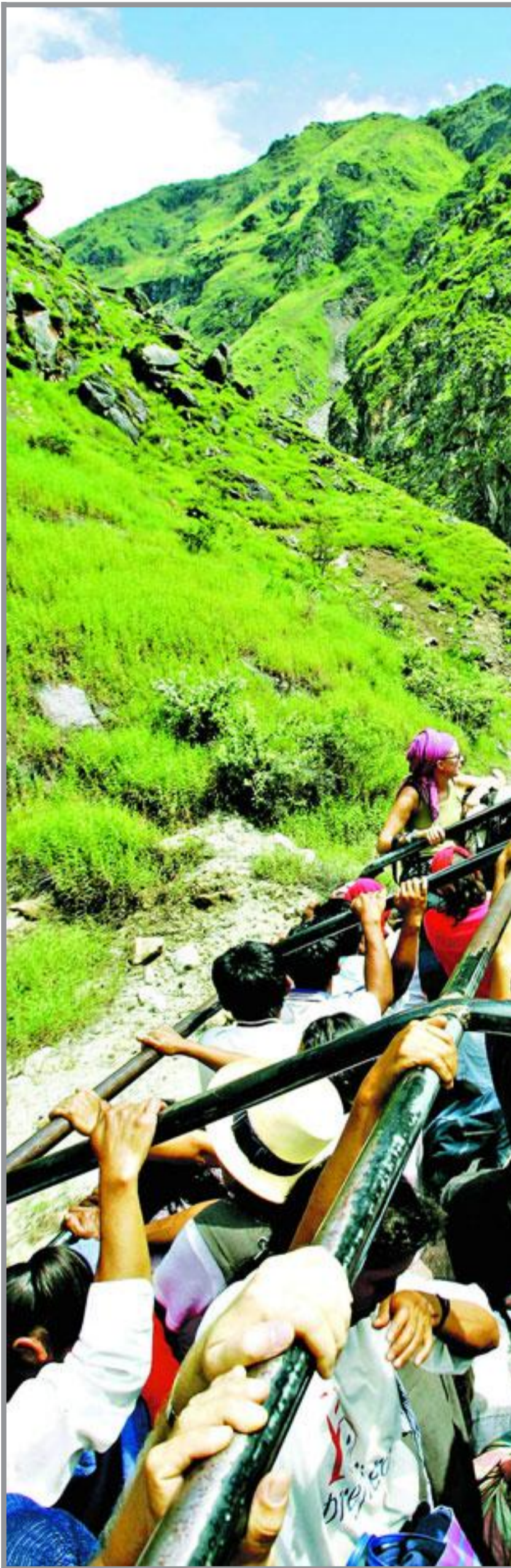
LASTEBUSS: Vanlig fremkomstmiddel for fjellfolket er ombygde lastebiler.

sammen rundt elven på dette stedet. Fossene velter seg over klippekanten og faller i kaskader, slår seg til støv og danner mange små regnbuer over båt og mannskap. Det er