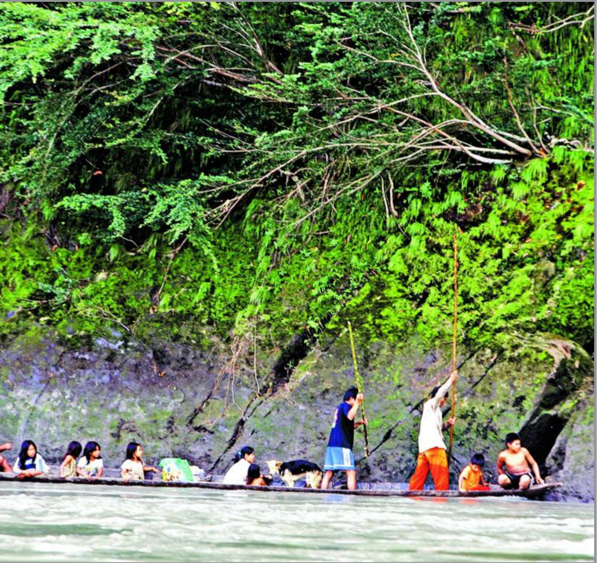
gamle stokkebåtene (uthult av en stamme) er fortsatt vanligste måte å ferdes på.

norsk ankom Lima etter å ha fløyet halve jorden rundt.