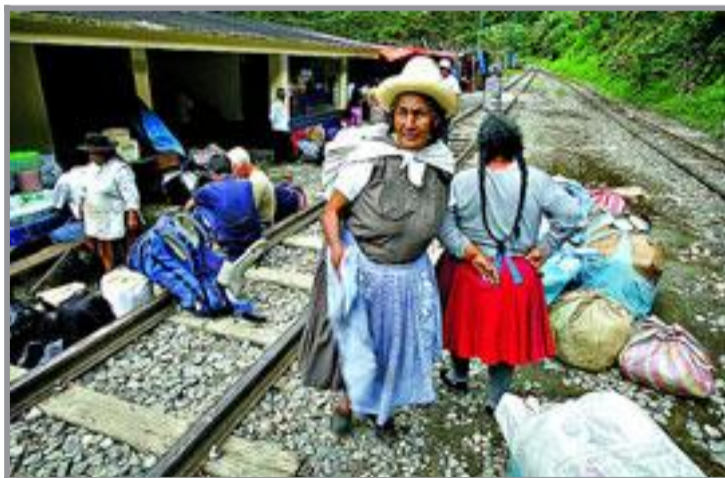
TOGSTASJON: Ingen kunne fortelle oss når toget gikk, bare at det gikk, så her ble det et par timers hvile på skinnene.

tet fire kroner for indianere, 10 for nasjonale og åtte dollar for internasjonale reisende.