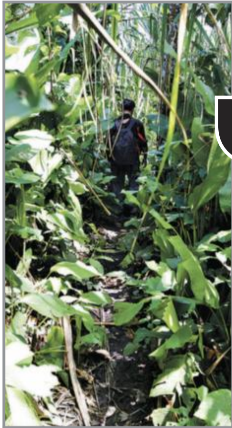
JUNDELSTI: Skal du gjennom jungel, ser stier ut som denne. Dette er eneste vei fra elva Urubamba opp til indianerlandsbyen Nueva Luz i machigengaindianernes land.