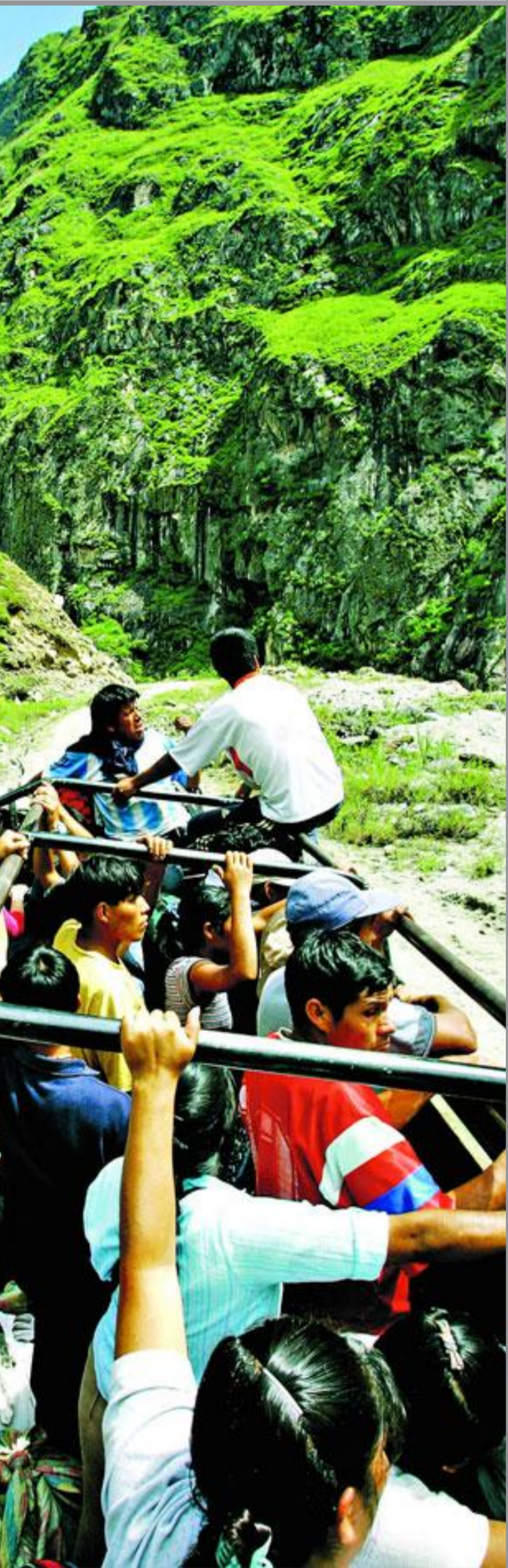
Bilen blir aldri full, eller i hvert fall virker det ikke slik.

Landsbyen er gjort om til et eneste stort sammensurium av markeder, hoteller og restauranter. Men for en morgenfugl var det unektelig en nytelse å kunne vandre opp til varme kilder og flyte rundt der en times tid mens dagen grydde, og minnes foregående kvelds fortreffelige middag av alpakkakjøtt og marsvin.