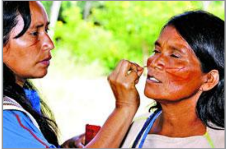
KRIGSMALING var det ikke, derimot pen pynt og identitetsmerker, ble vi forklart.

Vi slapp igjennom. Stemningen om bord blir mer avslappet. Juvet skiller lavjungel og høyjungel. Heretter